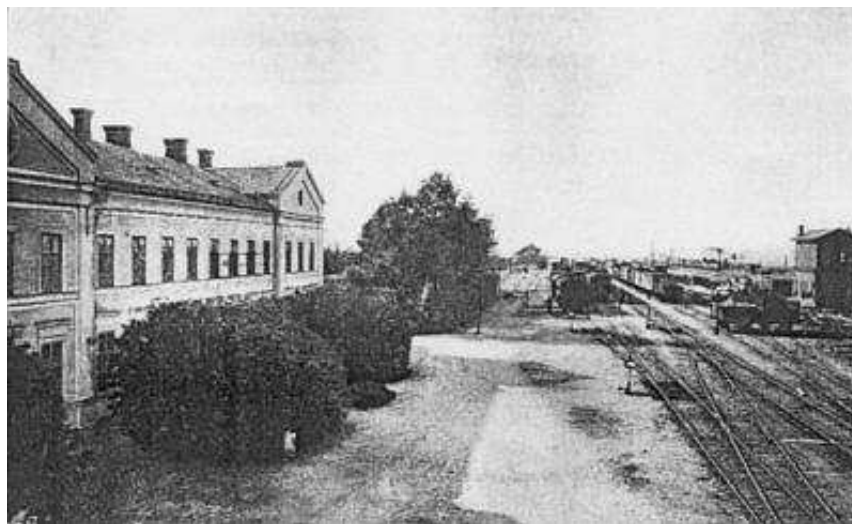
Aus: GDÖU I/2, 129.

Die Betriebsergebnisse vor 1914 gestalteten sich durchaus günstig: Im Jahr 1887 wurden noch 1,742.730 Tonnen Güter befördert, 1891 bereits 2,802.305, 1913 schließlich 7,511.757. Aufgrund dessen wurde bis 1915 der Abschnitt Sillein(Zilina)-Oderberg(Bohumin) doppelgleisig ausgestaltet.